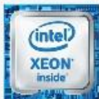
Cisco HyperFlex™ Systems với bộ xử lý Intel® Xeon®

Nền tảng của chúng tôi bao gồm một giải pháp mạng tích hợp, công nghệ tối ưu hóa dữ liệu mạnh mẽ và chức năng quản lý hợp nhất để khai thác tối đa tiềm năng của mô hình siêu hội tụ dành cho nhiều tải công việc và tình huống sử dụng khác nhau. Giải pháp này có tốc độ triển khai nhanh hơn, dễ quản lý và mở rộng hơn so với những hệ thống hiện tại đồng thời nó còn mang đến cho bạn một kho tài nguyên cơ sở hạ tầng hợp nhất để hỗ trợ các ứng dụng khi nhu cầu kinh doanh của bạn đòi hỏi.