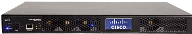
图 2. 思科网真 MCU 5300 系列基于标准，并兼容所有主要供应商的终端