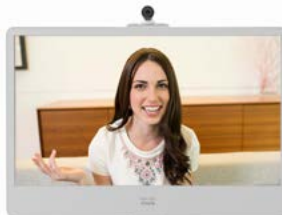
Устройства Cisco MX200/300 позволяют собрать сотрудников со всего мира в одном помещении.