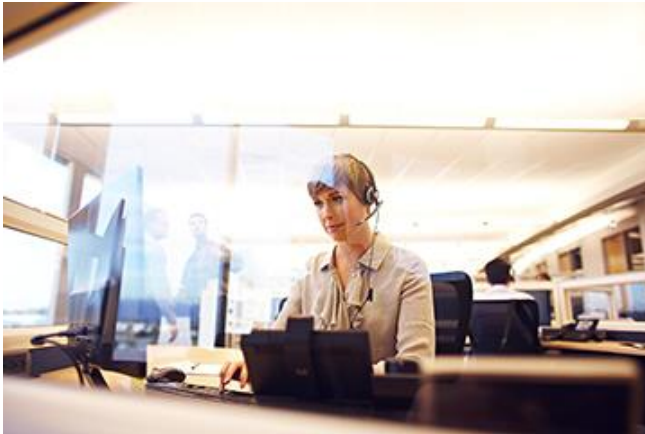
그림 3. Cisco Security Operations Center Help Desk

그림 3에 나와 있는 Cisco SOC(Security Operations Center)는 직원, 프로세스 및 툴의 지속적인 관리 및 내부 감사를 구현하는 Cisco ROS(Remote Operations Services) 그룹에 의해 운영됩니다. 이처럼 SOC는 Cisco 고객이 안심할 수 있도록 네트워크를 감독하며 최고 레벨의 보안 서비스를 제공합니다.