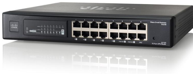
Figura 1. Router VPN para varias WAN Cisco RV016

Para proteger aún más la red y los datos, el Cisco RV016 incluye funciones de seguridad de primera clase y un filtrado web basado en la nube opcional. La configuración se realiza de manera sencilla a través de un administrador de dispositivos intuitivo basado en un navegador y asistentes de configuración.