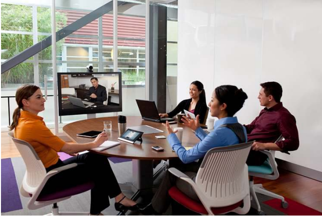
图 3. 大中型多功能会议室环境中的思科网真 MX300