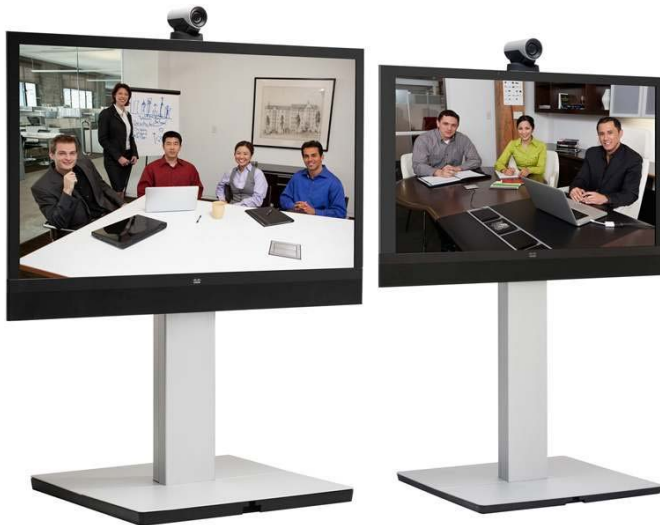
图 1. 落地式思科网真 MX300 和 MX200

大约花费 15 分钟安装完后，思科网真 MX200 和 MX300 终端会彻底改观多功能会议室的体验。该系统提供您希望从思科获得的高质量、易于使用的网真体验，其中融合安装简单、全球服务等特性，并且性价比使得广泛部署较以往更为轻松和经济实惠。