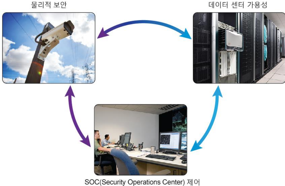
그림 1. Cisco Email Security 구성 요소