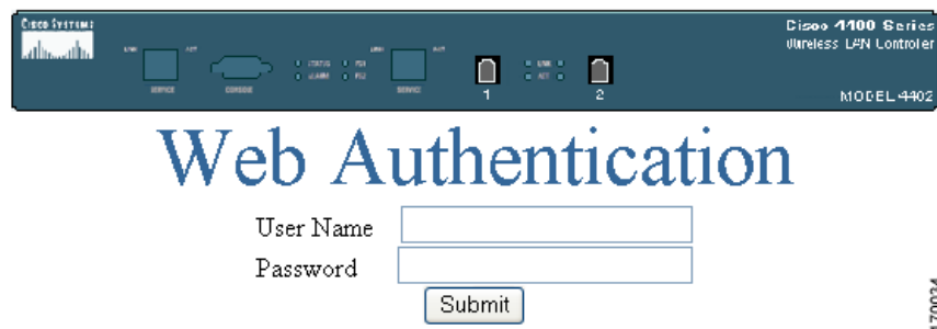
図 3-6 Login.html