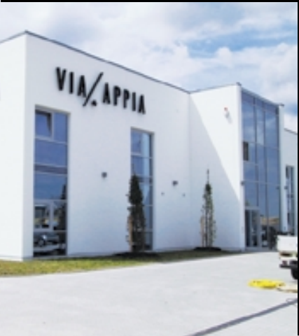
Via Appia in Erlangen

Wer in der Textilbranche mit den Marktführern konkurrieren will, muss mit seinem Angebot erfolgreich eine Nische besetzen und dort einen optimalen Wirkungsgrad entfalten. So hat sich das Modeunternehmen Via Appia in Erlangen auf aktuelle Trends in außergewöhnlichem Design für modebewusste Frauen im „Moder n-Woman-Bereich“ spezialisiert sowie auf elegante und passgenaue Übergrößen. Um dabei ertragreich zu agieren, braucht man jedoch nicht nur Fantasie und Kreativität, sondern auch perfekte IT-Organisationsstrukturen. Dazu gehört selbstverständlich eine leistungsstarke, möglichst effizient funktionierende Bürokommunikation. Deshalb hat Via Appia eine zukunftssichere, strukturierte Netzwerkarchitektur geschaffen, die Telefongespräche und Daten über ein Leitungsnetz befördert, und zwar auf der Basis entsprechender Voice-over-IP-Komponenten von Cisco.