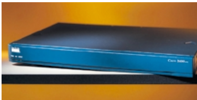
Cisco Router 2600 Serie

ter werden einfach an die Datenleitung gestöpselt und sind mit der Zentrale via Gateway-Router und Standleitung verbunden. Analoge Endgeräte (schnurlose DECT-Telefone bzw. Faxmaschinen) sind an beiden Standorten über Cisco-Router ans öffentliche Fernsprechnet angeschlossen.