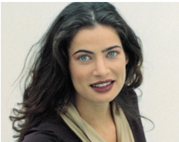
Mode von Via Appia

Dementsprechend musste man im Röthelheim-Park das EDV-Netz komplett neu aufbauen und mit dem Hauptsitz verbinden, außerdem hätte für den Neubau eine neue Telefonanlage beschafft werden müssen.