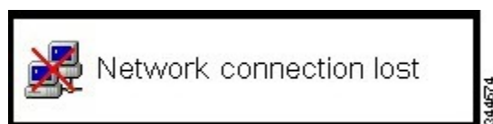
図 1 : [Network Connection Lost] オーバーレイ

最新の画面データの上に、メッセージ「Network connection lost」を重ねて表示し、ネットワーク接続の喪失を示します。このオーバーレイは、クライアント ネットワーク ケーブルが切断されているか、クライアントが PCoIP プロトコルトラフィックを受信していない時間が 2 秒を超えると表示されます。