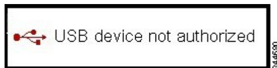
図 3: [USB Device Not Authorized] オーバーレイ

未承認の USB デバイスが接続されると、メッセージ「USB device not authorized.」がオーバーレイ表示されます。このオーバーレイは約 5 秒間表示されます。