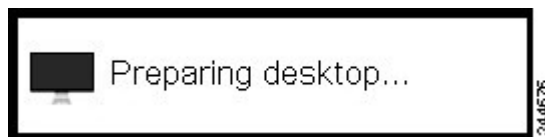
図 2: [Preparing Desktop] オーバーレイ

初めて PCoIP セッションにログインすると、メッセージ「Preparing desktop」がオーバーレイ表示されます。