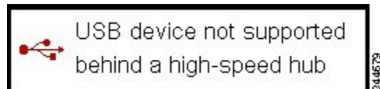
図 5 : [USB device not supported behind a high-speed hub] オーバーレイ

一部の USB デバイスは高速 (USB 2.0) ハブから接続できないため、直接ゼロ クライアントに接続するか、フルスピード (USB 1.1) ハブから接続します。そうしたデバイスが高速ハブからゼロ クライアントに接続されている場合、メッセージ「USB device not supported behind high speed hub」がオーバーレイ表示されます。このオーバーレイは、約 5 秒間表示されます。