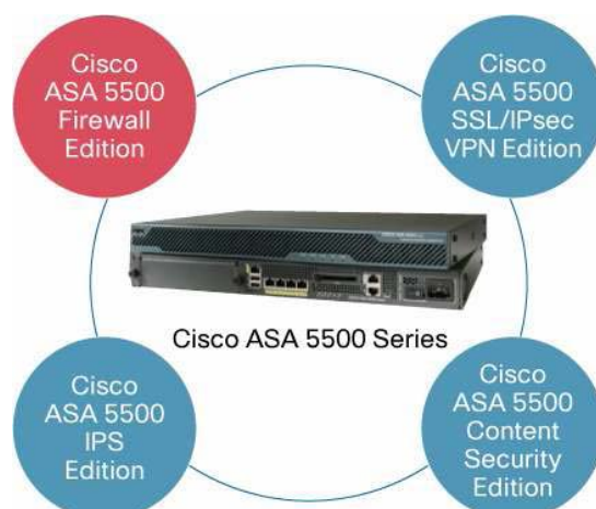
図2 補完的ソリューション

これらのパッケージは、適切なサービスを適切な場所に配備することで優れた保護を実現します。また、Cisco ASA 5500 シリーズ プラットフォームで標準化できるため、管理、トレーニング、およびスペアに要するコストを削減できます。さらに、各エディションは、あらかじめパッケージ化されたロケーション固有のセキュリティ ソリューションを提供するので、設計と展開が簡素化されます。