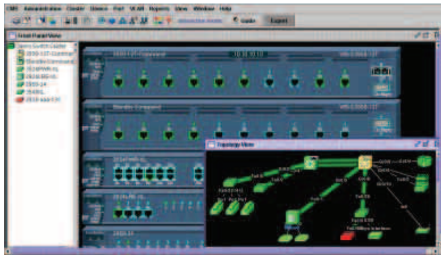
그림 1. 클러스터 관리 슈트: 프론트 패널과 토폴로지 뷰

1. 브라우저에 JRE(compatible Java) 플러그인이 설치되어 있어야 합니다.