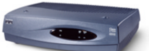
그림 1 Cisco 1710 보안 액세스 라우터 사진