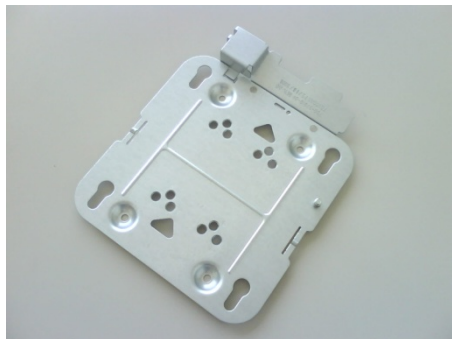
AIR-AP-BRACKET-1 AP ブラケット: ロープロファイル デフォルトのオプション