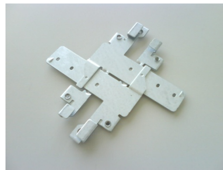
AIR-AP-T-RAIL-F 天井グリッド クリップ (フラッシュ サーフフェイス)

* 埋め込み型天井グリッド クリップを使用すると、天井タイルとの間に段差が生じない取り付けが可能です。追加の 1/4 インチ ギャップを使用しても、設置の安全性やセキュリティには影響しません