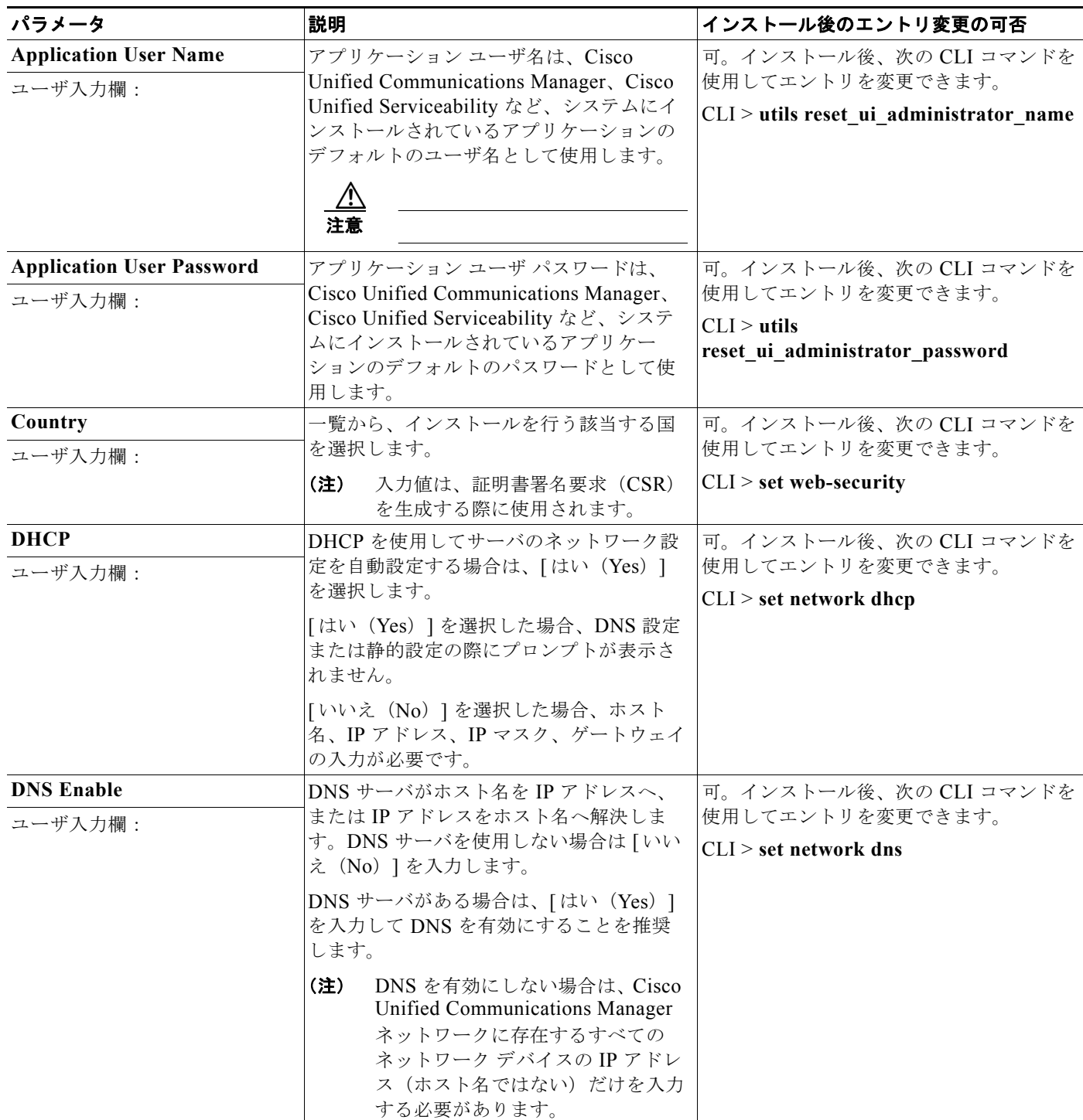
表 10 ノードの設定データ (続き)