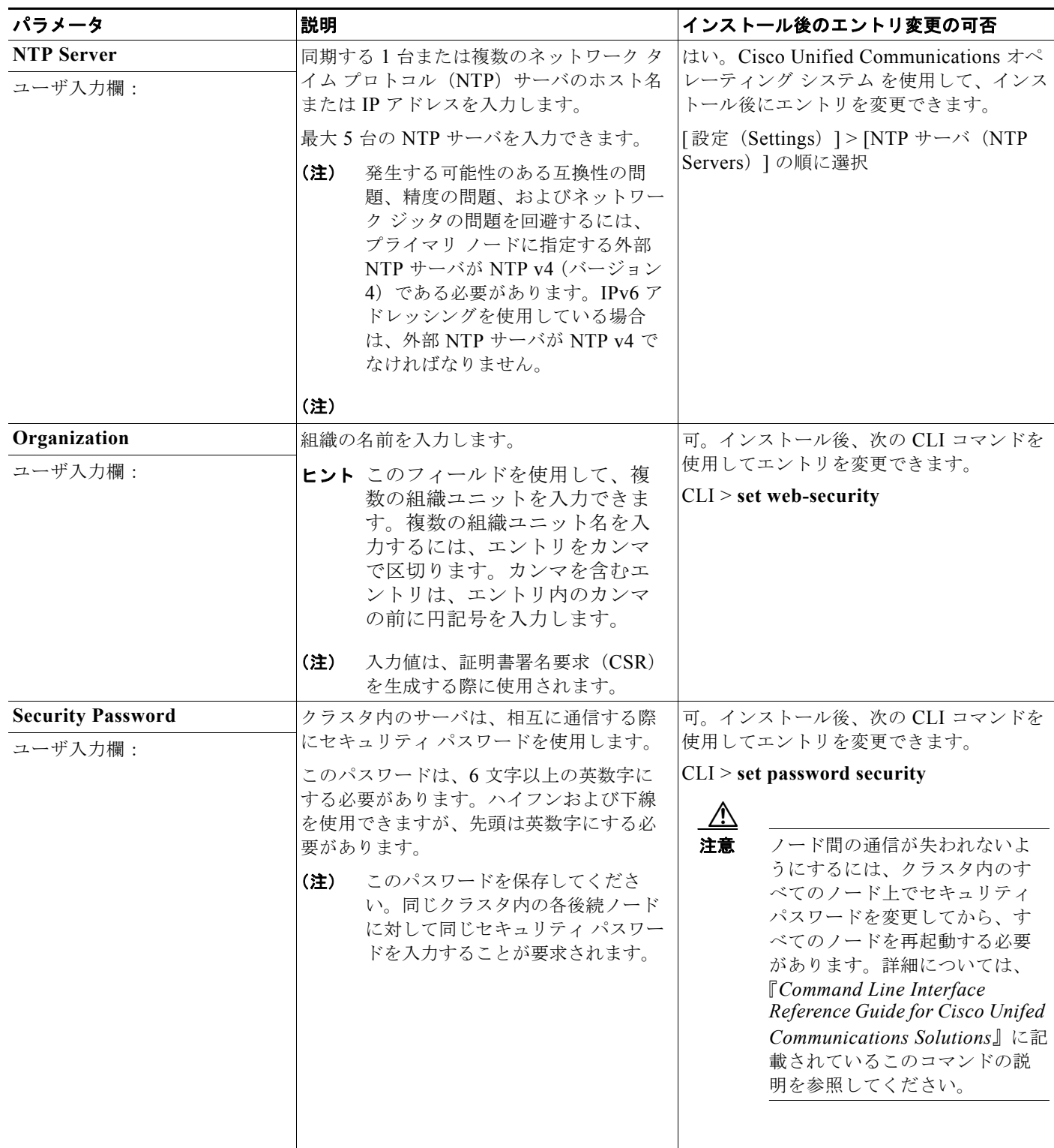
表 10 ノードの設定データ (続き)