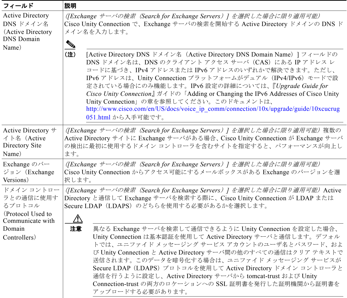
表 9-5 [ユニファイドメッセージングサービスの編集 (Edit Unified Messaging Service)] ページ、Microsoft Exchange