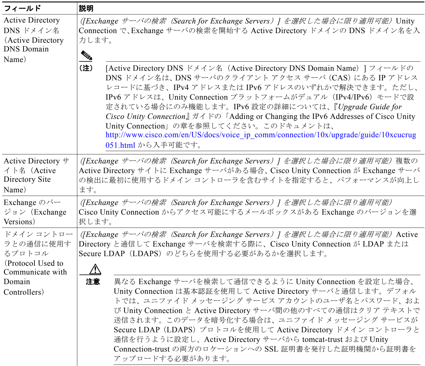
表 9-2 [ユニファイドメッセージング サービスの新規作成 (New Unified Messaging Service) ] ページ、Microsoft Exchange