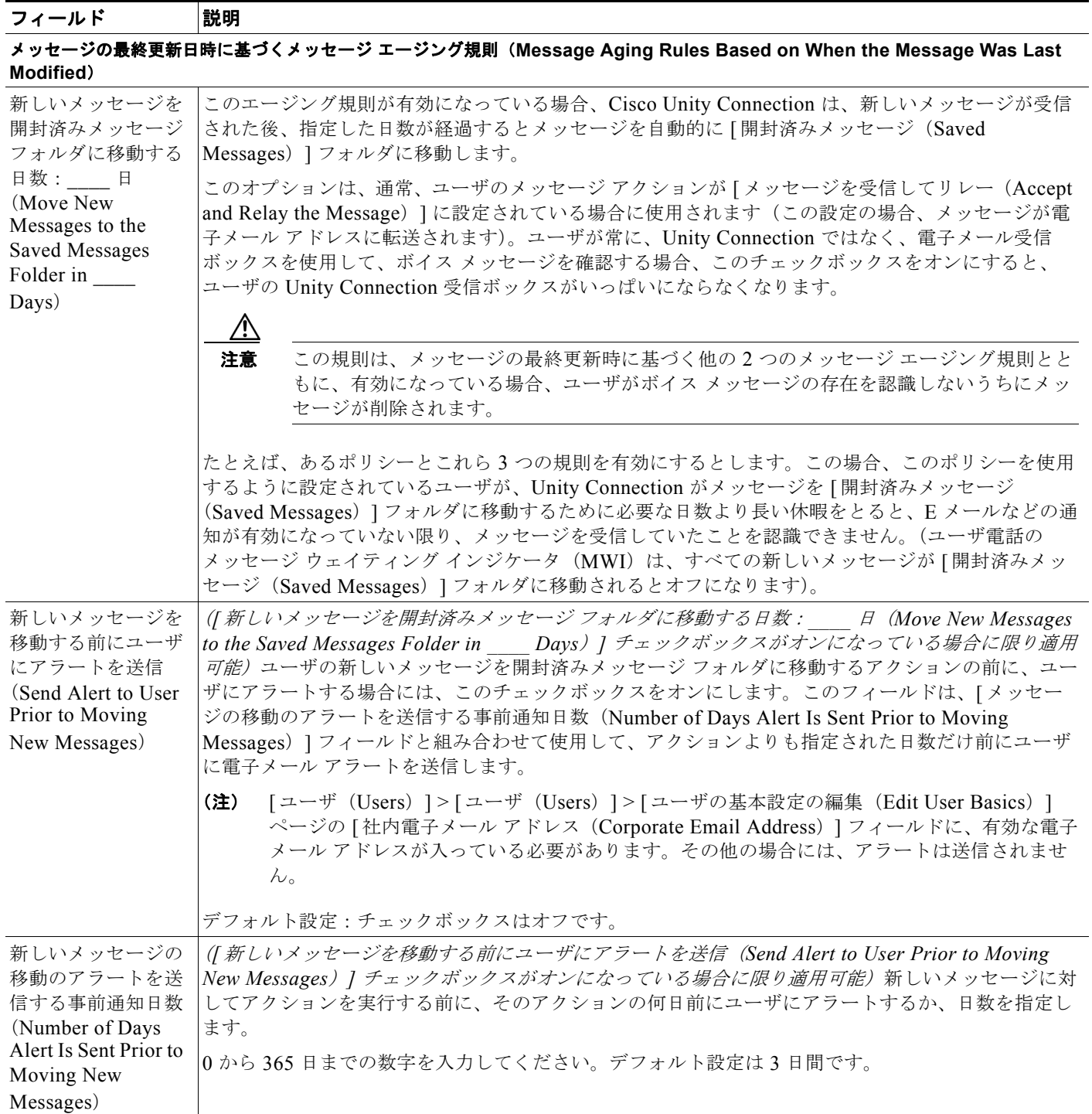
表 7-9 [メッセージエージングポリシー (Message Aging Policy)] ページ (続き)