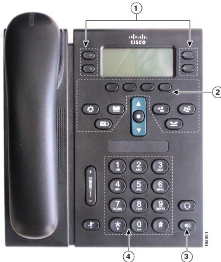
図 3：運動障がい者向けの機能：Cisco Unified IP Phone 6941 を表示

次の図に、例外として特記されている場合を除き、Cisco Unified IP Phone 6921、6941、6945 および 6961 でサポートされている機能を示します。次の図に示す機能の説明を下の表に示します。