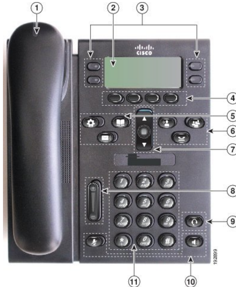
表 2：視覚障がい者向けアクセシビリティ機能