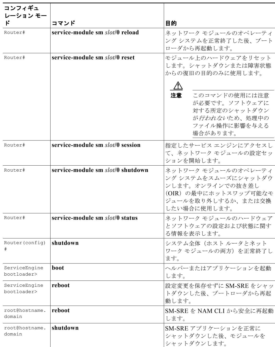
表 3 共通のシャットダウン、起動コマンド