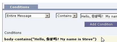
Figure 10: 内容过滤器中的多个字符集

可以在一个内容过滤器中混搭多个字符集。要获取有关显示和输入采用多个字符编码的文本的帮助，请参考网络浏览器文档。大多数浏览器都可同时显示多个字符集。