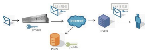
Figure 1: 验证工作流程