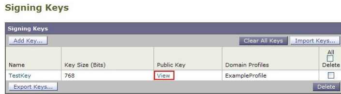
Figure 2: “签名密钥” (Signing Keys) 页面上的查看公钥链接