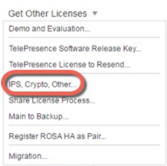
图 2: IPS、加密、其他

步骤 4 在 Search by Keyword 字段中，输入 asa，并选择 Cisco ASA 3DES/AES License。