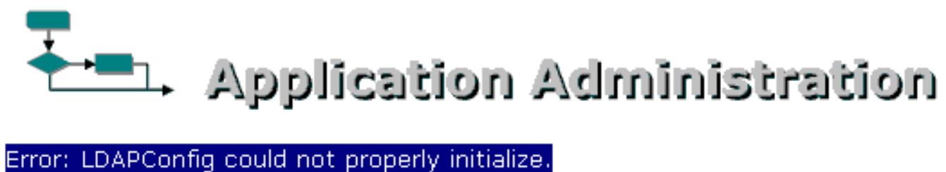
图2 ? Error:LDAPConfig不能适当地初始化

当您设法访问CVP Application Administration页时，错误消息出现(请参见图2)而不是图1显示的页。这是错误消息：