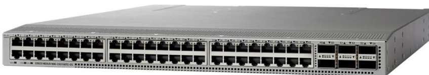
图 2. Cisco Nexus 93108TC-EX 交换机

Cisco Nexus 93108TC-EX 交换机（图 2）是一款 1RU 交换机，支持 2.16 Tbps 带宽，吞吐量超过 1.7 bpps。93108TC-EX 的 48 个 10GBASE-T 下行链路端口可配置为 100 Mbps、1 Gbps 或 10 Gbps 端口。上行链路可以支持最多 6 个 40 Gbps 和 100 Gbps 端口，或 10、25、40、50 和 100 Gbps 的连接组合，提供灵活的迁移选项。