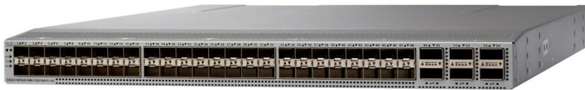
图 1. Cisco Nexus 93180YC-EX 交换机

Cisco Nexus 93108TC-EX 交换机（图 2）是一款 1RU 交换机，支持 2.16 Tbps 带宽，吞吐量超过 1.7 bpps。93108TC-EX 的 48 个 10GBASE-T 下行链路端口可配置为 100 Mbps、1 Gbps 或 10 Gbps 端口。上行链路可以支持最多 6 个 40 Gbps 和 100 Gbps 端口，或 10、25、40、50 和 100 Gbps 的连接组合，提供灵活的迁移选项。