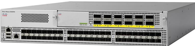
图 4. Cisco Nexus 9396PX 交换机

Cisco Nexus 9396TX 交换机是一款 2RU 交换机，支持最高 1.92 Tbps 带宽，具有 48 个非模块化 1/10GBASE-T 端口，吞吐量超过 1500 mpps，以及一个上行链路模块（请参见本文档后的图 8 和 9），最多支持 12 个非模块化 40 Gbps QSFP+ 端口（图 5）。