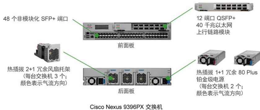
图 7. Cisco Nexus 9300 平台组件

为了提高可用性，该平台支持 1+1 冗余热插拔 80 Plus 铂金级认证电源和热插拔 2+1 冗余风扇托架。