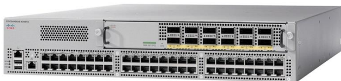
图 5. Cisco Nexus 9396TX 交换机

Cisco Nexus 93128TX 交换机是一款 3RU 交换机，支持最高 2.56 Tbps，具有 96 个非模块化 1/10GBASE-T 端口，吞吐量超过 750 mpps，以及一个上行链路模块（请参见本文档后的图 8 和 9），最多支持 8 个非模块化 40 Gbps QSFP+ 端口（图 6）。