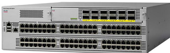
图 6. Cisco Nexus 93128TX 交换机

上行链路模块提供适用于 Cisco Nexus 9396PX、9396TX 和 93128TX 的 40 Gbps 端口，用户可对其进行维修和更换。适用于 Cisco ACI 的 Cisco Nexus 9300 平台枝叶交换机提供三个上行链路模块。