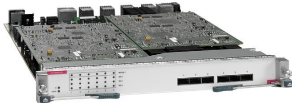
图 1. 带 XL 选项的 Cisco Nexus 7000 M2 系列 6 端口 40 千兆以太网模块

Cisco Nexus 7000 系列交换机是思科® 统一交换矩阵的基础。该系列是一个模块化数据中心级产品系列，专为可高度扩展的万兆以太网而设计。该交换矩阵架构的速度能扩展至 15 TB/秒 (Tbps) 以上，可支持高密度 40 和 100 千兆以太网部署。为满足大多数任务关键型网络环境的要求，这些交换机可持续提供各种系统运行和虚拟化服务。Cisco Nexus 7000 系列以业界认可的思科 NX-OS 软件操作系统为基础，具备多种强化功能，凭借出众的可管理性和适用性来完成实时系统升级任务。软件统一交换矩阵的创新设计专用于支持将 IP 和存储网络整合到单一无损以太网交换矩阵之上。