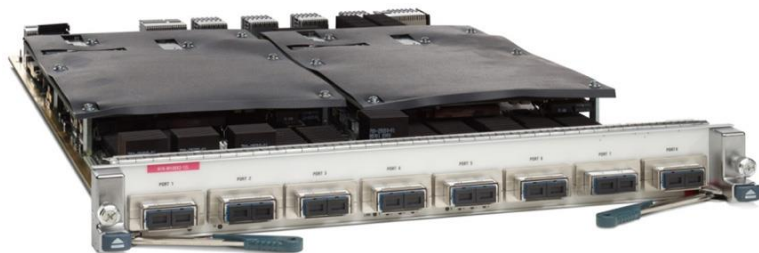
图 1. 带 XL 选项的 Cisco Nexus 7000 M1 系列 8 端口万兆以太网模块

Cisco Nexus 7000 系列交换机是一个模块化数据中心级产品系列，专为可高度扩展的万兆以太网而设计，其交换矩阵架构的速度能扩展至 15 Tbps 以上，可支持高密度 40 和 100 千兆以太网部署。这些交换机旨在满足大多数任务关键型网络环境的要求，可提供持续的系统运行和虚拟化普及服务。Cisco Nexus 7000 系列以业界认可的思科® NX-OS 操作系统为基础，具备多种强化功能，凭借出众的可管理性和适用性来完成实时系统升级任务。其统一交换矩阵的创新设计专用于支持将 IP、存储和进程间通信 (IPC) 网络整合到单一以太网交换矩阵之上。