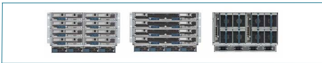
图2. Cisco UCS 5108刀片服务器机箱和刀片服务器的前视图和后视图

Cisco UCS 5108刀片服务器机箱支持4个前端访问的单相热插拔电源。这些电源的效率高达92%，能配置为非冗余、N+1冗余和N+N冗余配置。机箱的后端包括8个热插拔风扇、4个电源接口（每个电源一个接口），和2个用于放置Cisco UCS 2104XP阵列扩展模块的I/O托架。一个无源中间面板为每服务器插槽提供高达20 Gbps的I/O带宽，两个插槽共40 Gbps的I/O带宽。该机箱能支持未来的40Gb以太网标准。