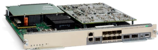
图 1. 管理引擎 6T

Cisco® Catalyst® 6800 管理引擎 6T (图 1) 是管理引擎系列新增的最新产品。管理引擎 6T 旨在提供更高的性能、更好的可扩展性和更强的硬件支持的功能。管理引擎 6T 集成了高性能的 6T 交叉开关交换矩阵, 可在 Cisco Catalyst 6807-XL 机箱的主用-备用模式下实现每个插槽 440 Gb 的交换容量。管理引擎 6T 上的转发引擎能够为第 2 层和第 3 层服务提供高性能转发。管理引擎 6T 的丰富功能集包含传统 IP 转发、第 2 层和第 3 层多协议标签交换 (MPLS) VPN、VPLS、MACSEC 等现有应用功能, 以及即时访问、SGT、支持硬件的 BTD 卸载和带内生成等新功能。Cisco Catalyst 6800 管理引擎 6T 通过所有功能和技术进步确立了在下一代企业园区部署中的产品领先地位。