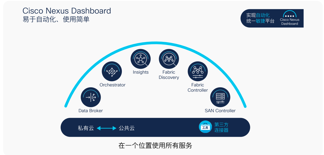
图 1. Cisco Nexus Dashboard: 通过统一、敏捷的网络平台实现自动化