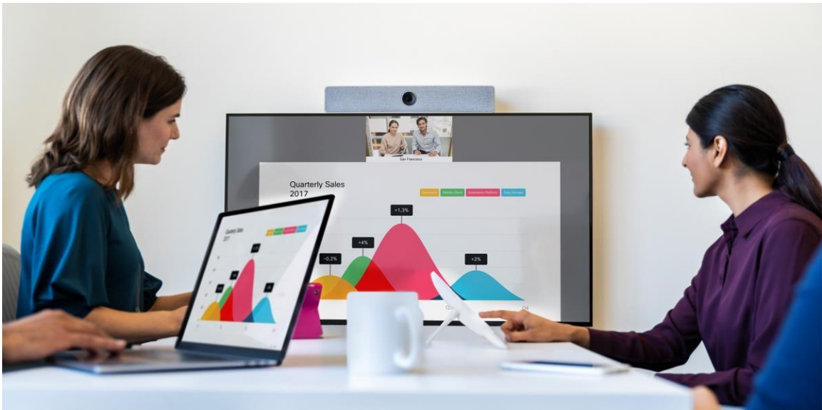
图 1. 思科 Webex Room Kit Mini 在小型会议室中的应用

Room Kit Mini 提供 120 度视野，能够将小型团队协作空间里的所有人员纳入画面，因此是三到五人的小型团队协作空间的理想之选。此外，它还可以灵活地通过 USB 接口连接到笔记本电脑，为视频会议软件提供高质量的视音频采集能力。Mini 紧密集成了行业领先的思科 Webex 平台，可实现持续的工作流，并支持本地注册或注册到思科 Webex 协作云。