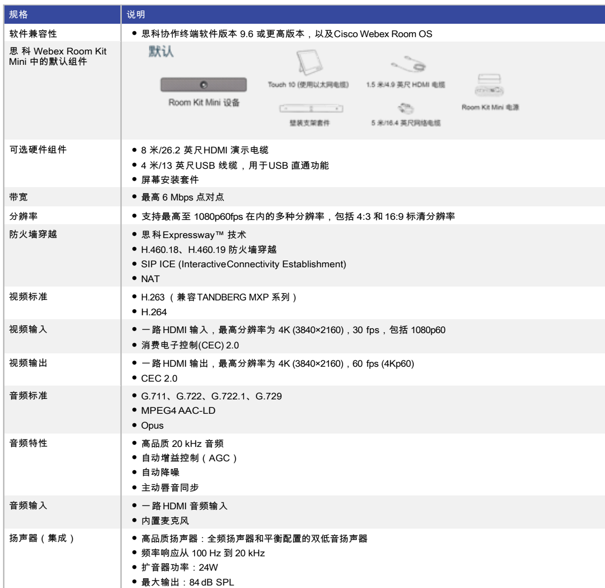
表 2. 规格