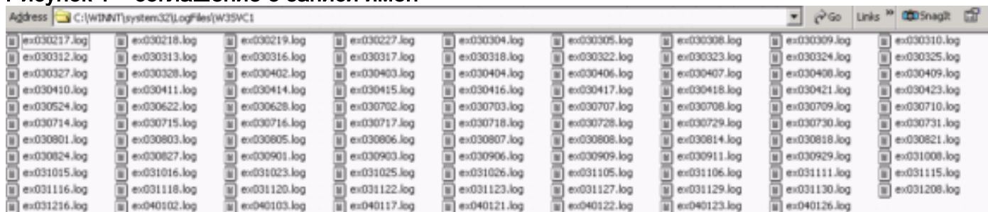
Рисунок 1 – соглашение о записи имен

IIS c:\winnt\system32\LogFiles\W3SVC1. Эти файлы именуются в соответствии с определенным правилом ex*.log (см. рис. 1). В этих файлах содержатся сведения о клиентских запросах к веб-серверу.