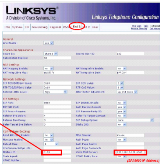
Figure 6: SPA IP Phone Configuration Utility, Ext 1 Page