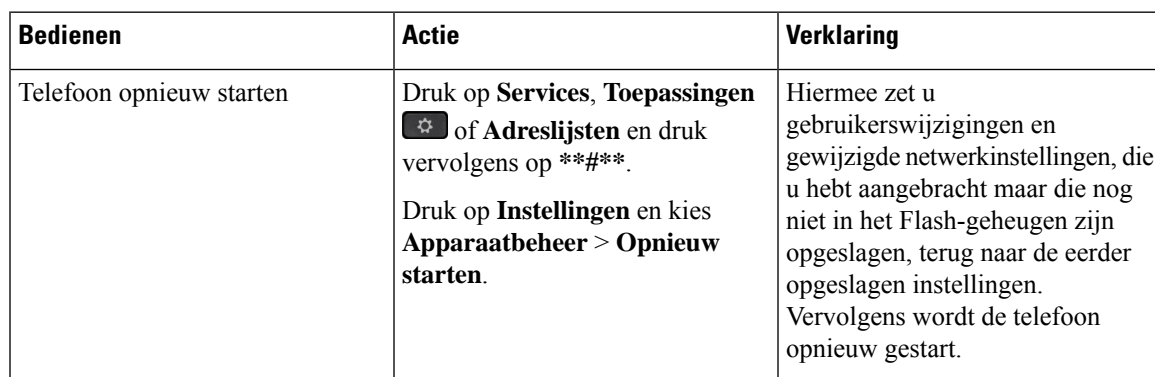
Tabel 1: Methoden voor resetten van basisinstellingen

In de volgende tabel wordt beschreven hoe u de basisinstellingen kunt resetten. U kunt een telefoon resetten met een van de volgende bewerkingen nadat de telefoon is opgestart. Kies de bewerking die past bij uw situatie.