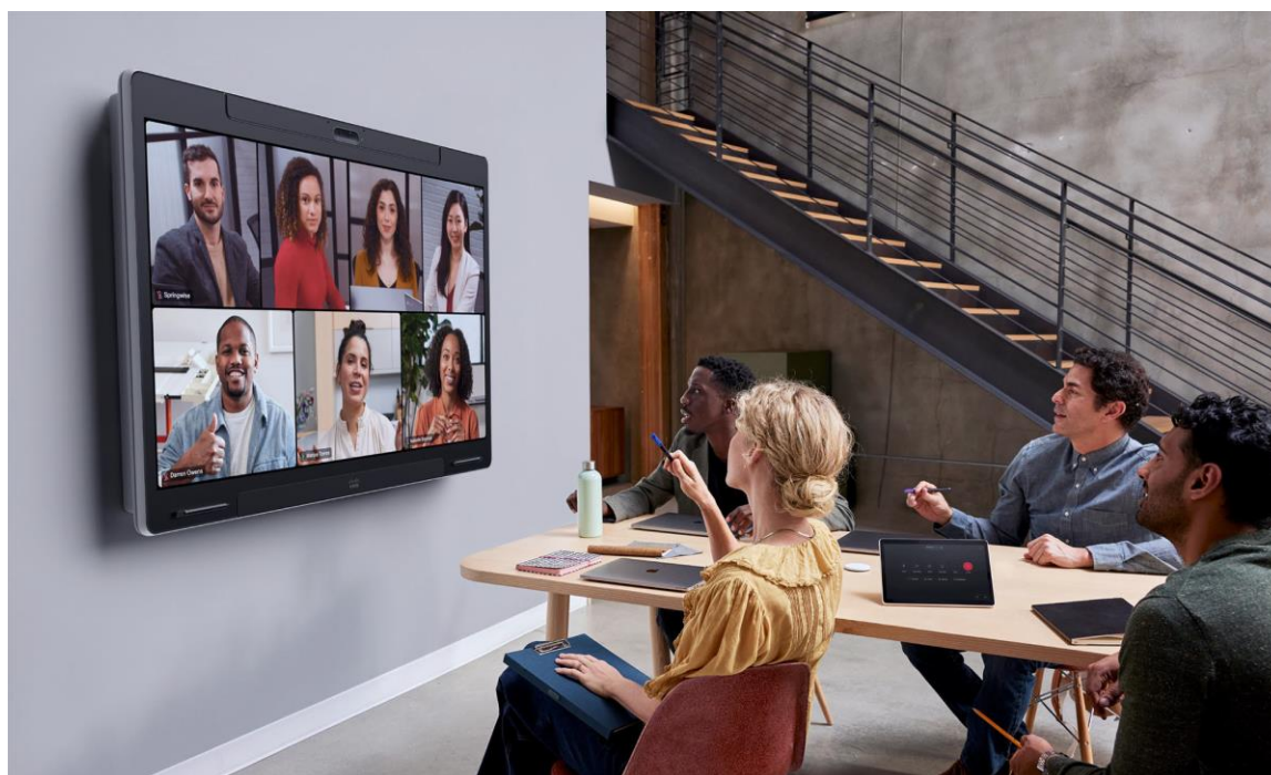
Figuur 1. Videovergadering met de wandsteun Board Pro 75 G2