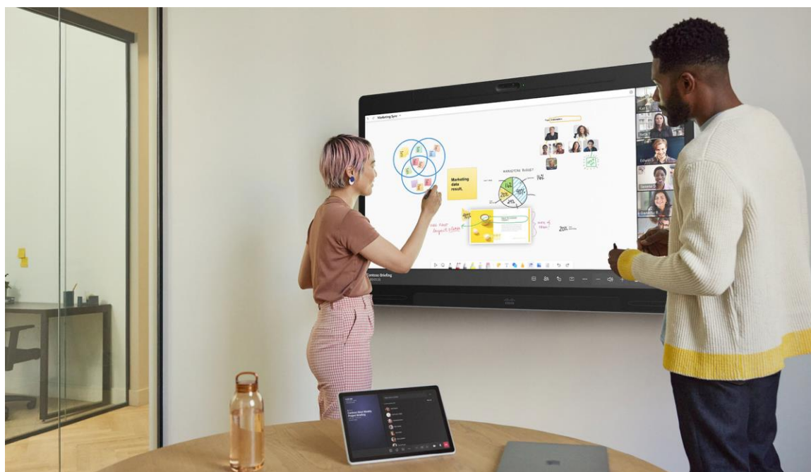
Figuur 2. Digitaal whiteboard in een Microsoft Teams vergadering via de Board Pro 55 G2

Beter nog, het is een ruimte-apparaat dat de connectiviteit ondersteunt met een externe PTZ-camera om filmische presentatoren te volgen voor meer inclusieve hybride training, presentatie en gebeurtenisscenario's.