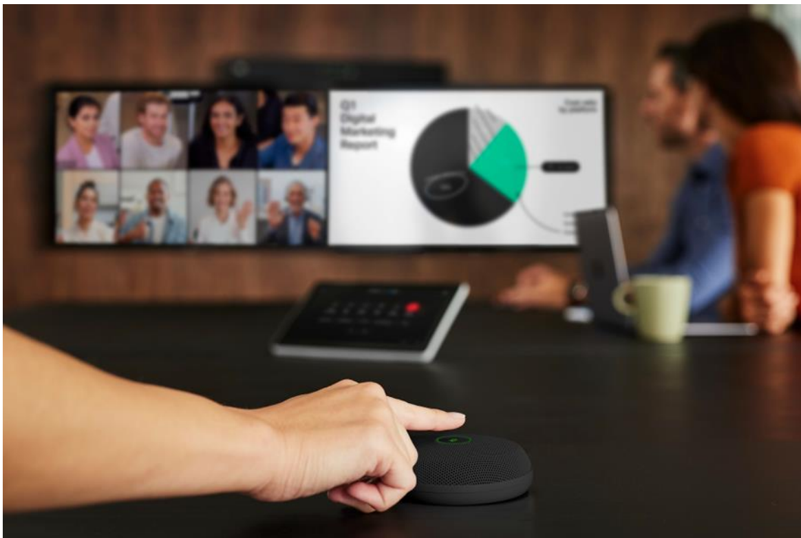
Figuur 1. De zwarte Cisco Table Microphone Pro op een vergadertafel die verbonden is met de Room Bar Pro.