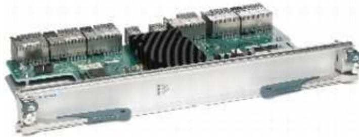
그림 1. Cisco Nexus 7000 10슬롯 패브릭 모듈

Cisco Nexus 7000 시리즈 새시용 Cisco Nexus 7000 패브릭 모듈(그림 1 및 2)은 개별적인 패브릭 모듈로서 I/O와 슈퍼바이저 모듈 슬롯 각각에 병렬 패브릭 채널을 제공합니다. 최대 5개의 액티브 패브릭 모듈을 동시에 사용하여 슬롯당 최대 230Gbps까지 끌어올립니다. 병렬 포워딩 아키텍처를 통해 5개의 패브릭 모듈에 8Tbps 이상의 시스템 용량을 확보할 수 있습니다. 이 패브릭 모듈은 I/O 모듈에서의 완벽한 분산 포워딩을 위한 중앙 스위칭 요소를 제공합니다.