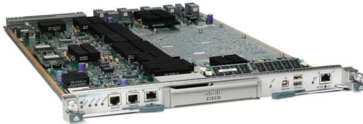
그림 1. Cisco Nexus 7000 Series Supervisor Module

Cisco® Nexus 7000 Series Supervisor Module(그림 1)은 확장 가능한 데이터 센터 네트워크에서 Cisco Nexus 7000 Series 시스템의 제어 플레인 및 데이터 플레인 서비스를 확장 지원합니다.