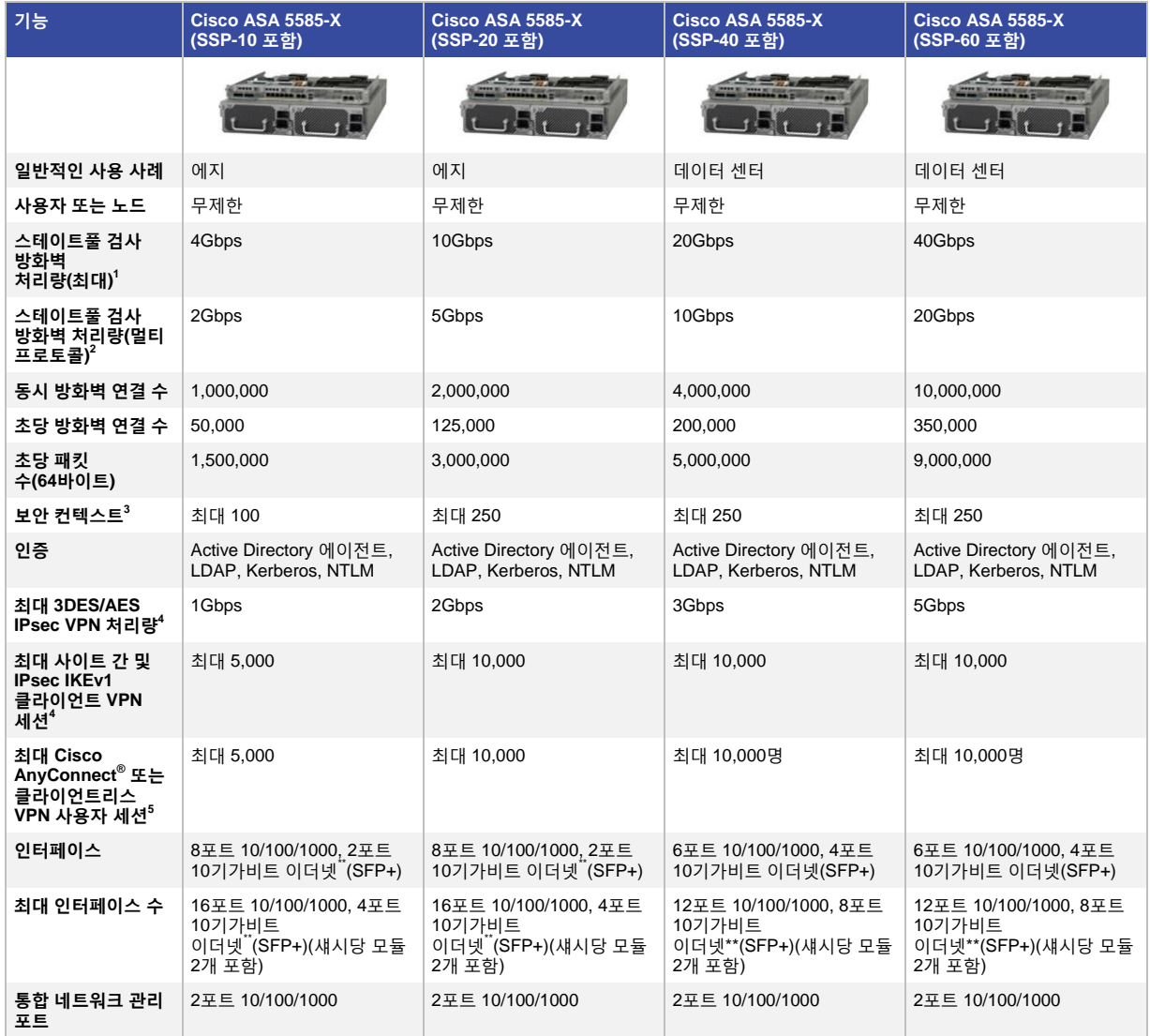
표 1. Cisco ASA 5585-X Next-Generation Firewall 기능 및 용량

표 1에서는 네 가지 Cisco ASA 5585-X 모델의 기능에 대해 설명합니다.