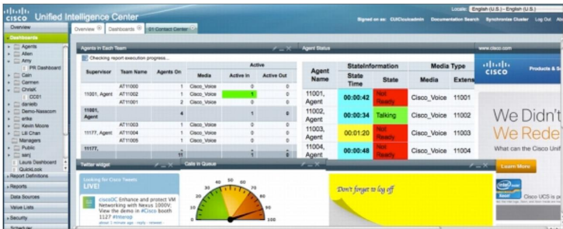
그림 1. Cisco Unified Intelligence Center 대시보드

이 웹 기반 보고 애플리케이션은 Cisco Contact Center 제품을 위한 편리한 마법사 기반의 애플리케이션에서 실시간 및 이전 데이터를 보고합니다. 고객 센터 관리자 및 비즈니스 사용자는 단일 인터페이스에서 고객 센터의 모든 채널에서 이루어진 모든 고객 문의의 세부 사항을 보고할 수 있습니다 (그림 1).