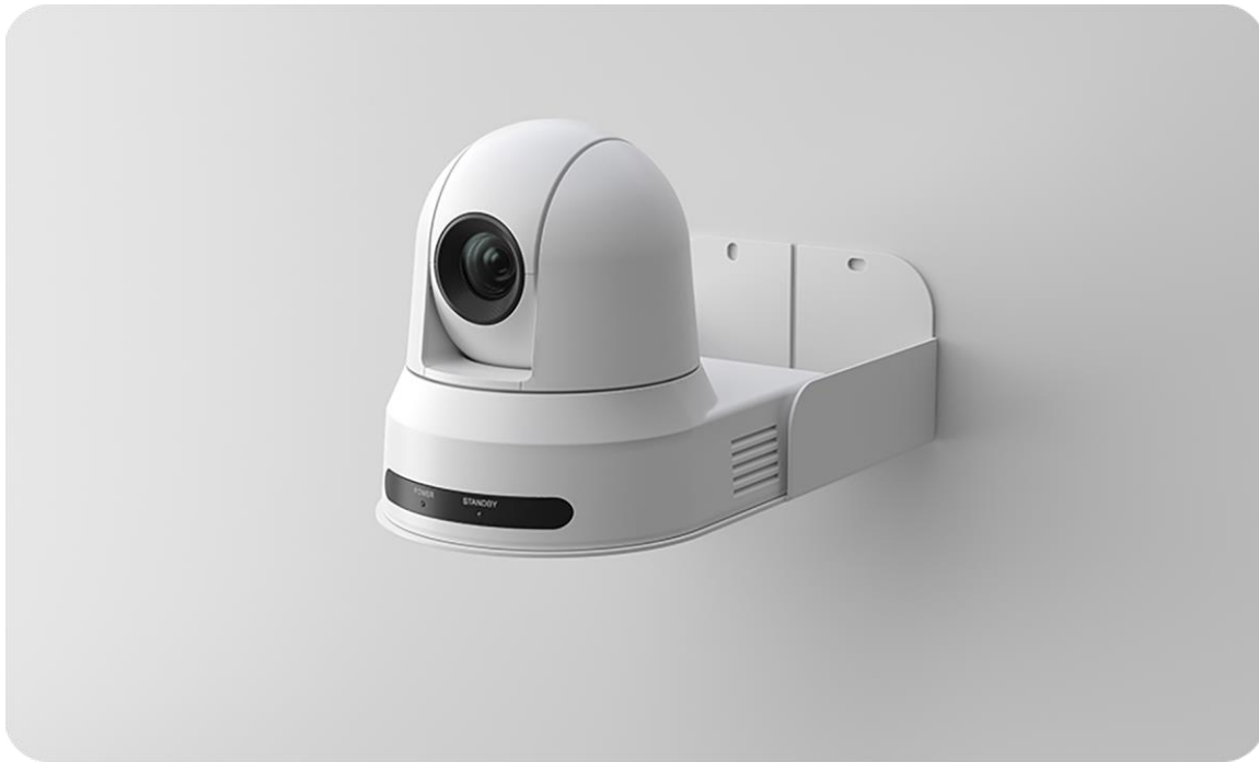
그림 1. Webex PTZ 4K 카메라

강력한 줌 기능을 갖춘 Webex PTZ 4K 카메라는 멀리 있는 물체, 프로토타입, 맨 끝에 앉아 있는 발표자 또는 발표자의 클로즈업 보기와 프레임링을 위한 고품질 비디오를 제공합니다. Codec Pro 또는 Codec Plus와 결합하여 AI 기반 얼굴 및 상체 감지 기능을 갖추고 있어 원격 참가자가 직접 참석자처럼 따라할 수 있는 자연스러운 상호 작용이 가능합니다. PTZ 4K 카메라를 사용하면 발표자가 발표하기 위해 서 있을 때, 그리고 마치 무대 위에 있는 것처럼 회의실 앞에서 자연스럽게 움직일 때 발표자를 감지, 프레임링 및 추적하여 보다 자유롭게 이동할 수 있습니다.