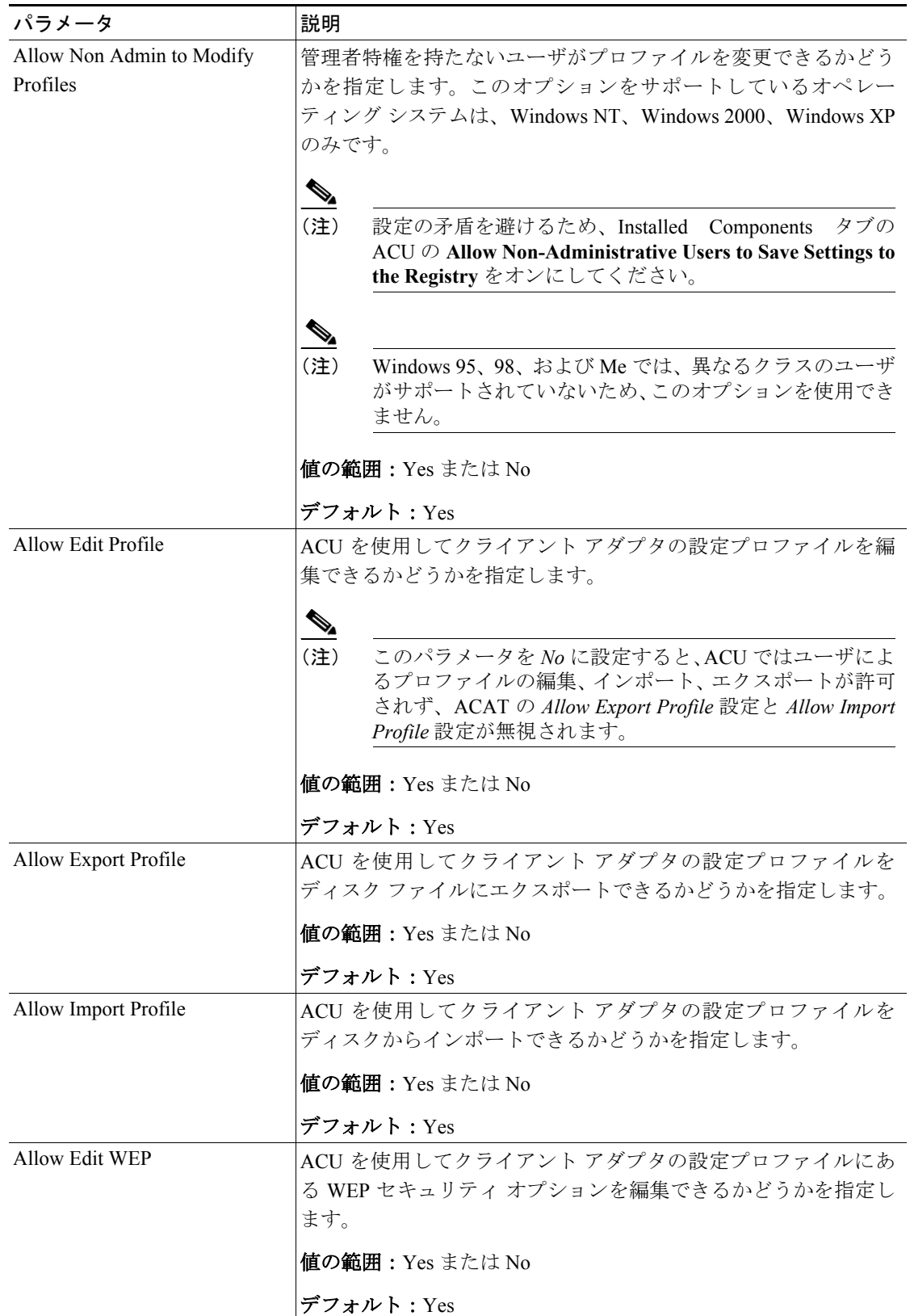
表 3-1 Global Override Settings タブのオプション

表 3-1 は、Global Override Settings タブのオプションを説明しています。