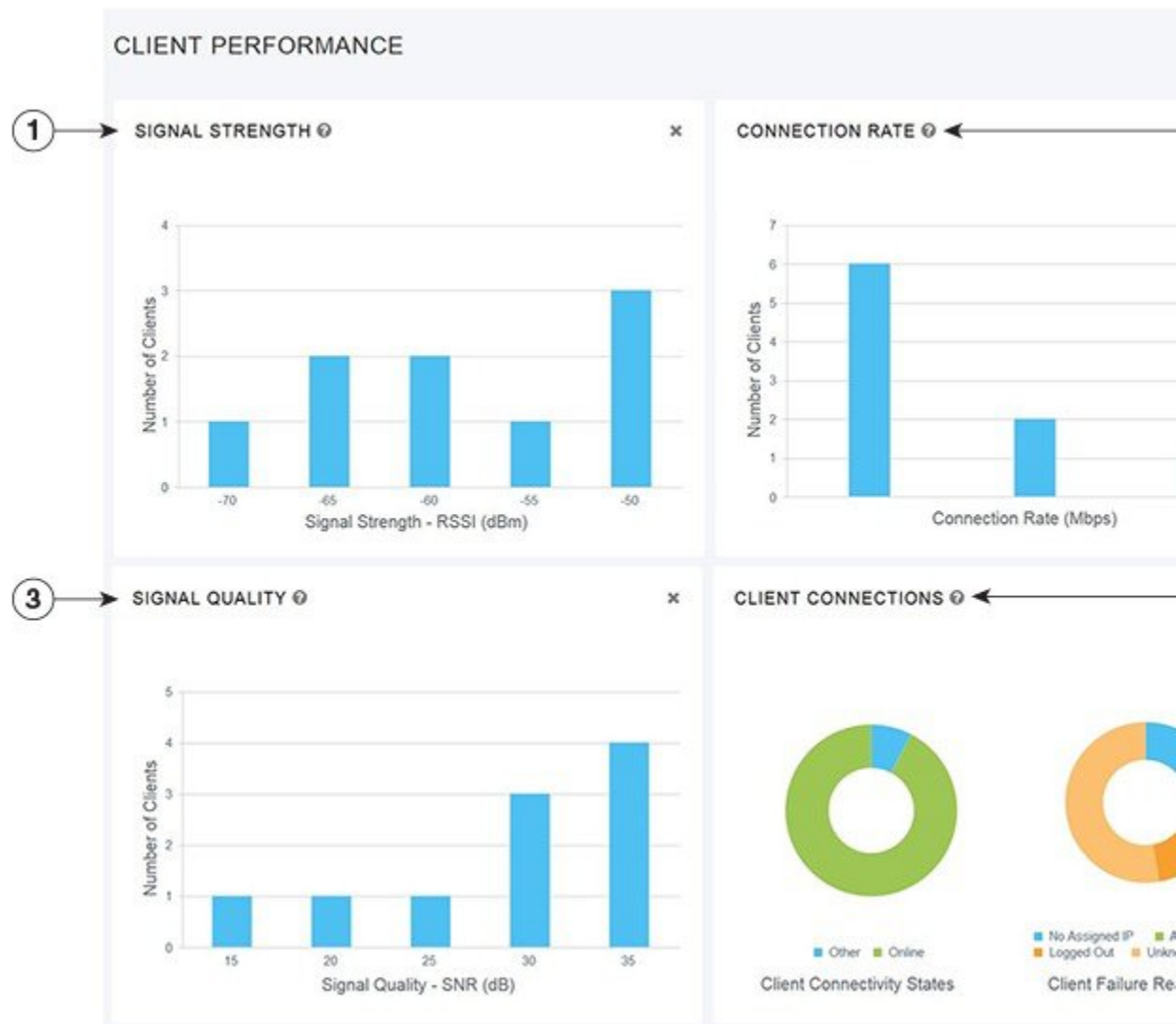
図 4 : [Wireless Dashboard] - [Client Performance]