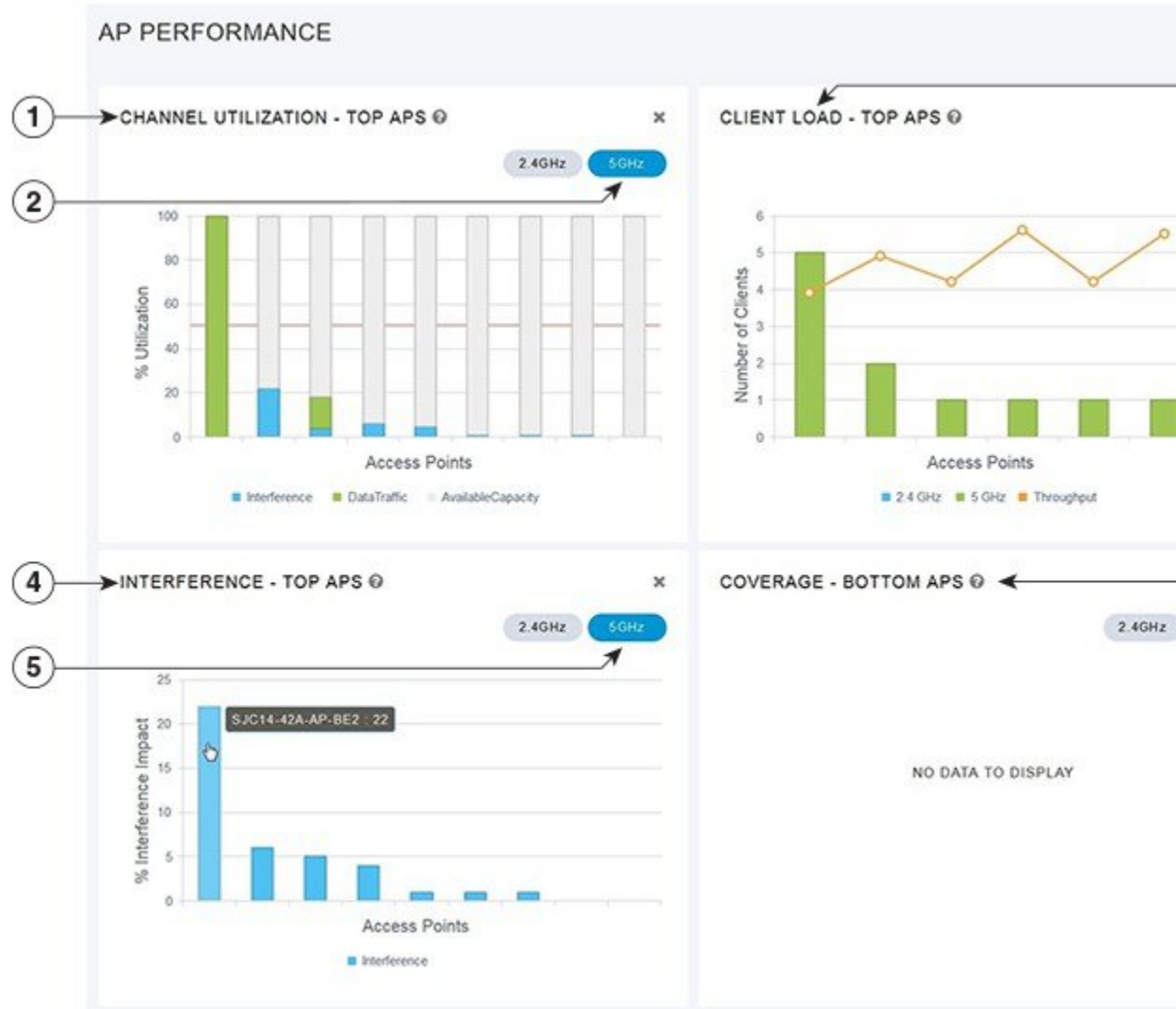
図 3: [Wireless Dashboard] - [AP Performance]

[AP Performance] ビューをカスタマイズするには、ウィジェットを追加または削除します。