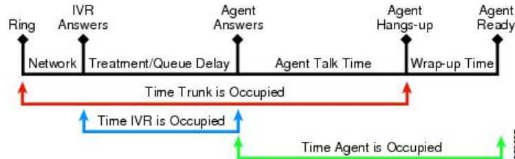
図 1: インバウンドコールのタイムライン

通話がすぐに応答されない場合は、通話タイムラインに呼び出し遅延時間（ネットワーク呼び出し音）を含めます。平均呼び出し遅延時間は数秒です。計算にはトランクの平均処理時間に追加します。