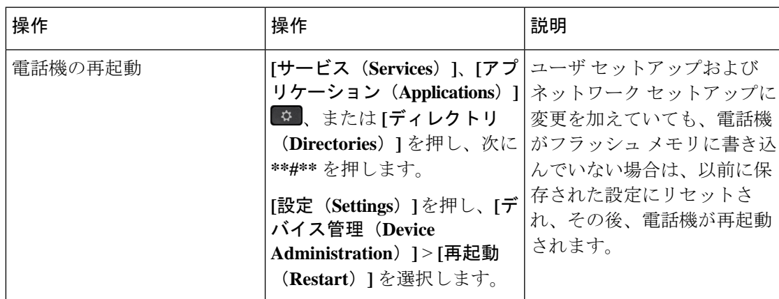
表 1: 基本的なリセットの方法

次の表で、基本的なリセットの実行方法を説明します。電話機が起動した後は、これらのいずれかの操作で電話機をリセットできます。状況に応じて適切な操作を選択します。