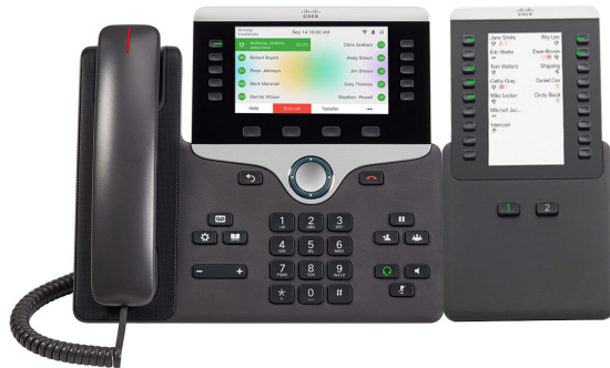
図 2: デュアル画面での Cisco IP 電話 8851/8861 キー拡張モジュール