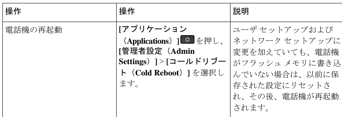
表 1: 基本的なリセットの方法

次の表で、基本的なリセットの実行方法を説明します。電話機が起動した後は、これらのいずれかの操作で電話機をリセットできます。状況に応じて適切な操作を選択します。