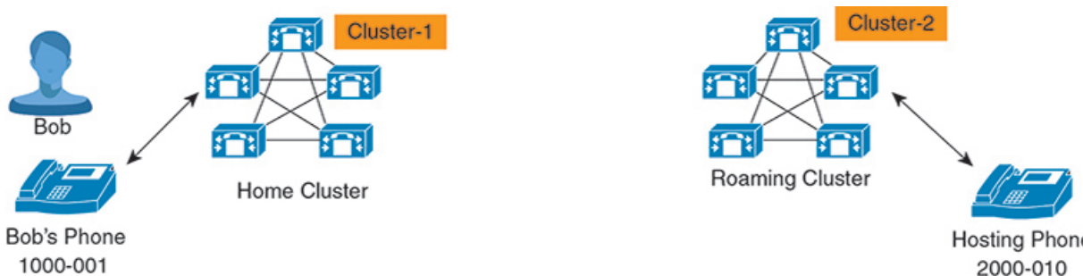
図 1: ホーム クラスタとローミングクラスタ