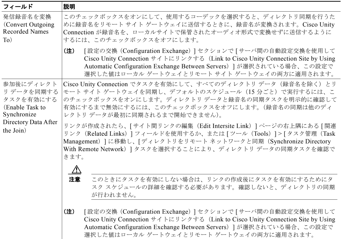
表 8-4 [サイト間リンクの新規作成 (New Intersite Link)] ページ (続き)