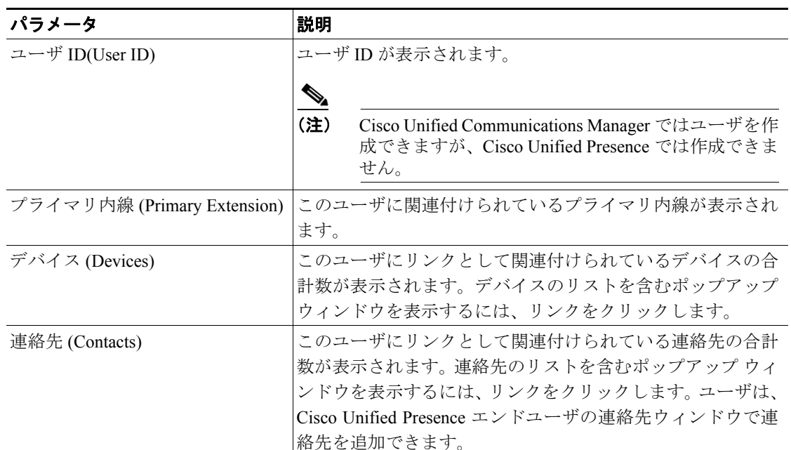
表 6-2 システムステータスの検索結果パラメータ

ステップ 3 ユーザに関連付けられているデバイスを表示するには、 [デバイス] リンクをクリックします。